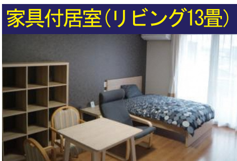
家具付居室(リビング13畳)