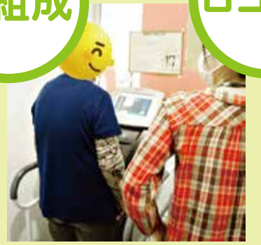
筋肉、脂肪の付き具合は？