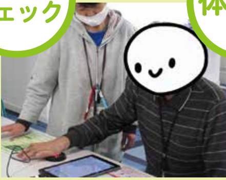
野菜を1日何gとれているかな？