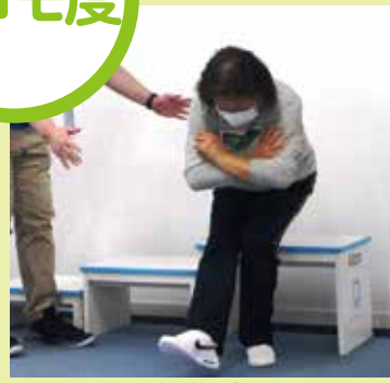
片脚で立ち上がれますか？