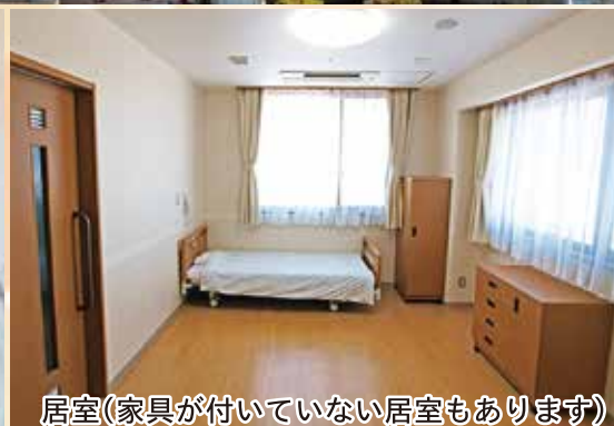
居室(家具が付いていない居室もあります)